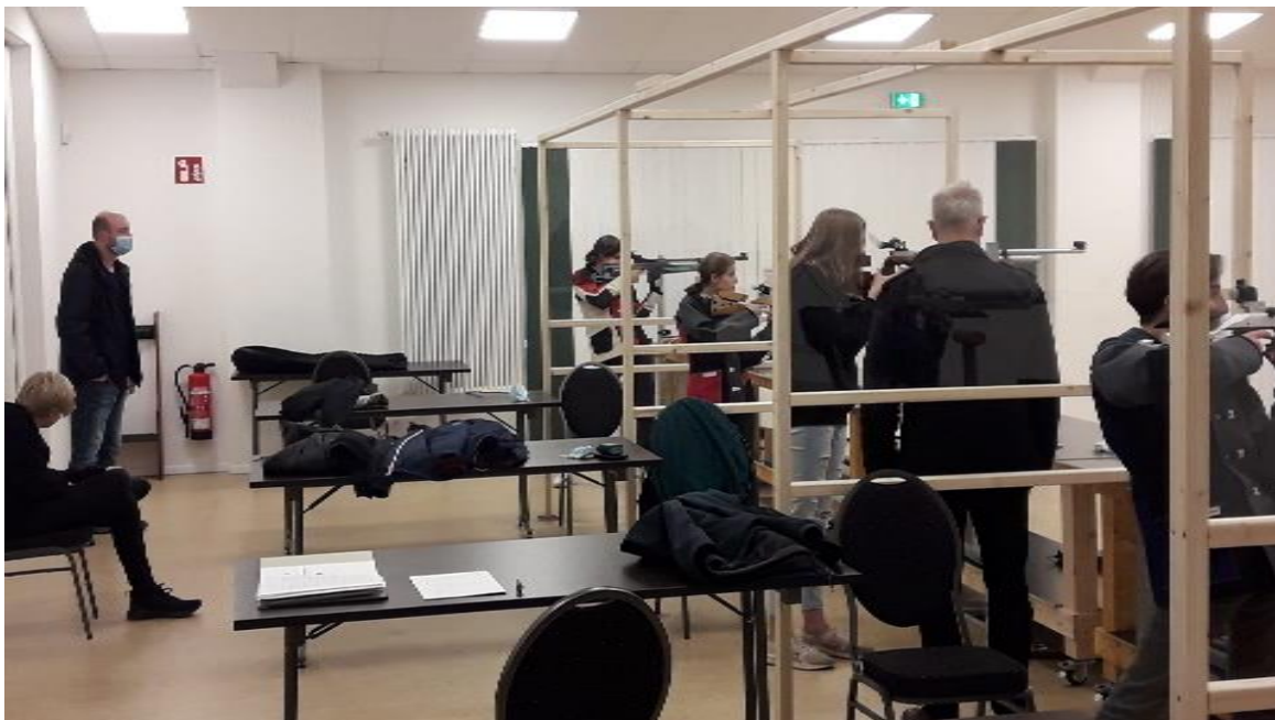
Wettkämpfer um die Vereinsmeisterschaft in Aktion

Die Vereinsmeisterschaften 2021 der Jugendabteilung wurden am 23. November ausgeschossen. Die diesjährigen Wettbewerbe standen unter dem Leitgedanken der Teilnahme am gemeinsamen Schießen und der Anwendung der geübten Schießfertigkeiten. Dank der pandemiegerechten Ausstattung unseres Schießstands und der großen Disziplin aller Beteiligten konnte das Schießen wie geplant stattfinden.