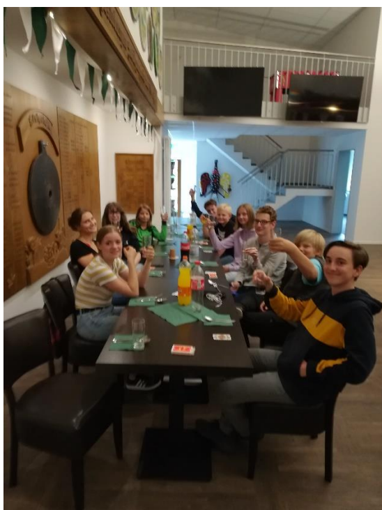
Der Besuch in der Trattoria