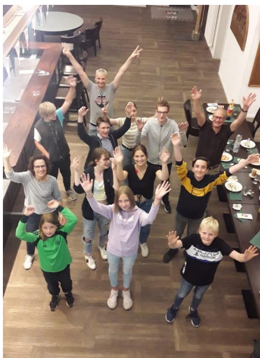
Die Hände zum Himmel .....

Stetes Training an den Sportgeräten mit dem Ziel einer Teilnahme an vielleicht stattfindenden Wettbewerben und dem Ausschießen der Jugendvereinsmeisterschaft im Herbst diente zur Motivation und Stärkung des Durchhaltewillens in diesen schwierigen Sportzeiten.